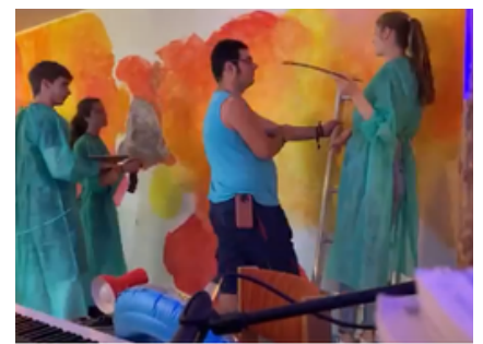
Gruppenraum wurde angemalt