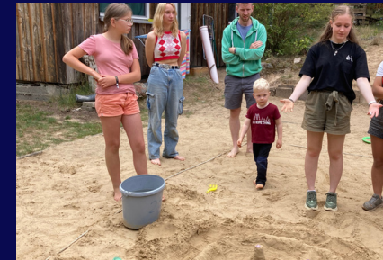
Wer hat die kreativste Sandburg gebaut?