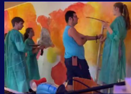
Gruppenraum wurde angemalt